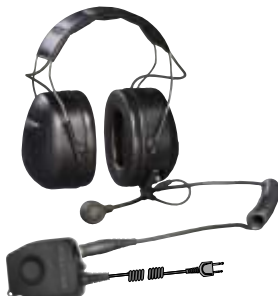
Standardheadset* kopplas via adapter* till olika kommunikationsradioenheter.

Med sitt noggrant utformade mikrofon/hörtelefonssystem och sin utmärkta dämpning erbjuder denna serie headset unika akustiska egenskaper och enastående kommunikation i miljöer med hög bullernivå. Peltors välbeprövade och tåliga konstruktionslösningar garanterar hög komfort och erbjuder lång hållbarhet och användning under hårda förhållanden.