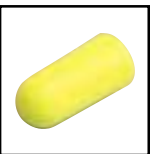
EarSoft hörselpropp Art nr: ES-01-002 20-pack