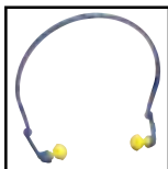
Flexicap Art nr: FX-01-000