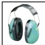
Peltor "KID" Art nr: H9A-02 315-TULI