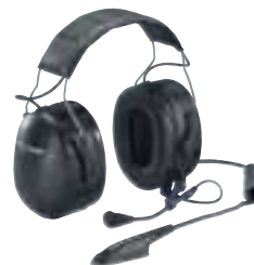
Headset* med direktkoppling till olika kommunikationsradioenheter. Inbyggd knapp för tala-funktion (PTT – "Push To Talk") på vänstra kåpan.