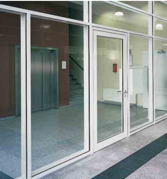
Schüco Firestop T90/F90 Brandschutztür/-Wandelement Fire door / fire-resistant wall unit