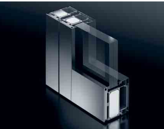
Schüco Firestop T90