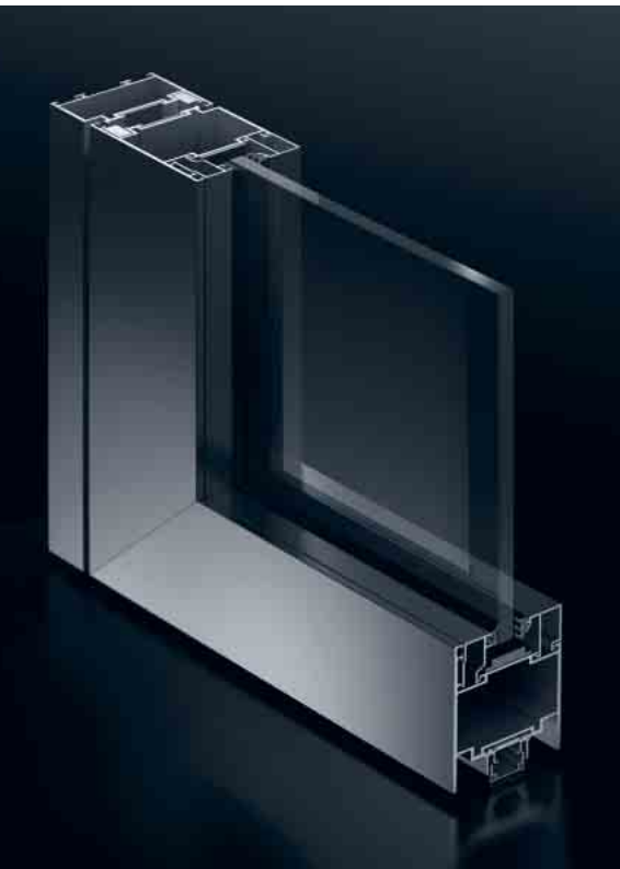
Schüco ADS 65.NI FR 30