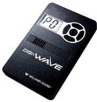
Digi-Wave ontvanger DLR-50 Art.-Nr: A-5030-0

De DLR-50 ontvangt signalen van één of meerdere DLT-100 zendontvangers in dezelfde groep. Iedere groep bevat minstens één DLT-100. Het aantal DLR-50 ontvangers per groep is oneindig. Belangrijk is dat al de ontvangers binnen het zendbereik van de DLT-100 zijn.