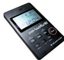
Digi-Wave zendontvanger DLT-100 Art.-Nr: A-5020-0

De DLT-100 is een zendontvanger, die spraak zendt naar andere DLT-100 zendontvangers en DLR-50 ontvangers. Het Digi-Wave systeem maakt het mogelijk om tot 4 gidssystemen in 2-weg-mode en tot 15 groepen in 1-weg-mode (Interpreter mode). In één groep kunnen tot 1024 DLT-100 zendontvangers en een oneindig aantal DLR-50 ontvangers worden gebruikt. Er kunnen diverse gebruikers specifieke accessoires aangesloten worden op de jack-aansluiting (bijv. oortelefoon, hoofdtelefoon, inductieus etc.). Als de gids en de bezoekers zijn uitgerust met DLT-100 zendontvangers, en de gids gebruikt de 'Chairman Master', kan de spreektijd worden bepaald. Daarnaast kan er gebruik worden gemaakt van de kiesfunctie.