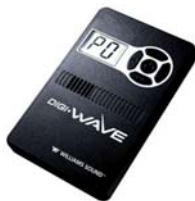
Digi-Wave ontvanger DLR-50 Art.-Nr: A-5030-0

De DLR-50 ontvangt signalen van één of meerdere DLT-100 zondontvangers in dezelfde groep. Iedere groep bevat minstens één DLT-100. Het aantal DLR-50 ontvangers per groep is oneindig. Belangrijk is dat al de ontvangers binnen het zendbereik van de DLT-100 zijn.