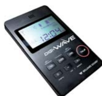
Digi-Wave zondontvanger DLT-100 Art.-Nr: A-5020-0

De DLT-100 is een zondontvanger, die spraak zendt naar ander DLT-100 zondontvangers en DLR-50 ontvangers.