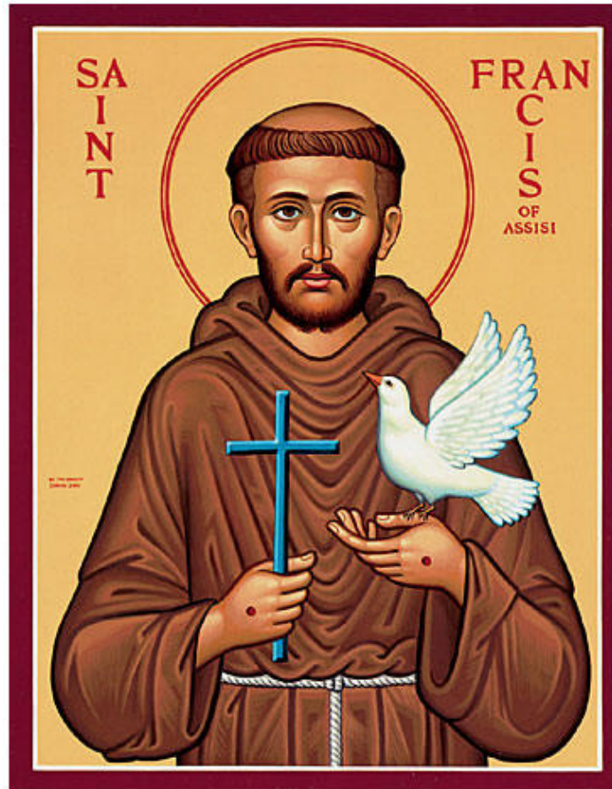
Den hellige Frans av Assisi