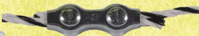
art nr. 80-143