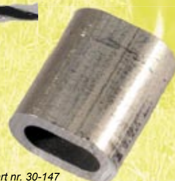
art nr. 30-147